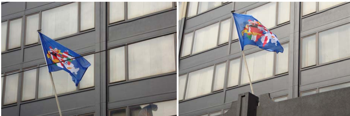
Proposal for a Flag , 2010, polyester knit fabric, 225 x 150 cm

In European Union ergänzen sich die verschiedenen Melodien einerseits zu harmonischen Passagen und erzeugen andererseits starke Dissonanzen, während derer sich einzelne Hymnen in den Vordergrund drängen. Es bleibt offen, ob dieser klangliche Zusammenschluss eine neue Hymne oder eine aufsässige Kakophonie darstellt.